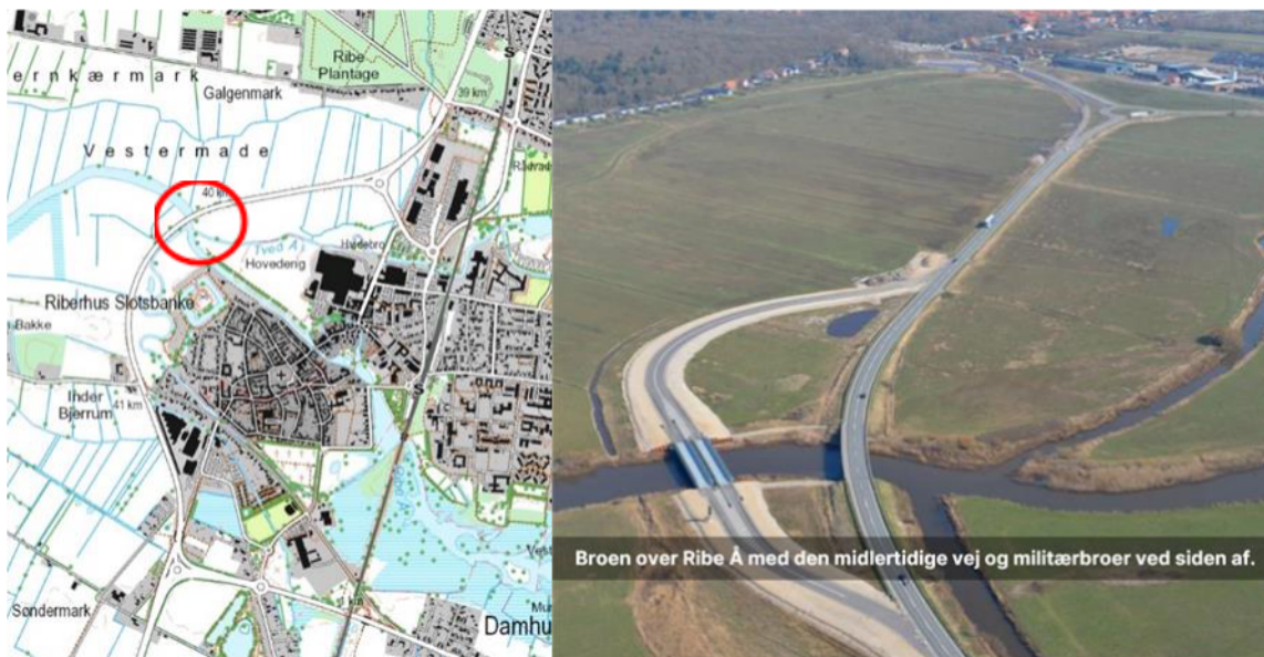
Figur 1. TH: Dronefoto ifm. sidste opsætning ved Ringvejen i Ribe. TV: Interimsbroen på den konkrete lokalitet.

Det kommende renoveringsarbejde får konsekvenser for brugerne af Ribe Sejlklub og Ribe Havn. Derfor retter vi henvendelse til jer nu, fordi vi har en stram tidsplan for arbejdet, og jeres medlemmer skal beslutte, hvorvidt deres både skal flyttes til Kammerslusen eller ej.